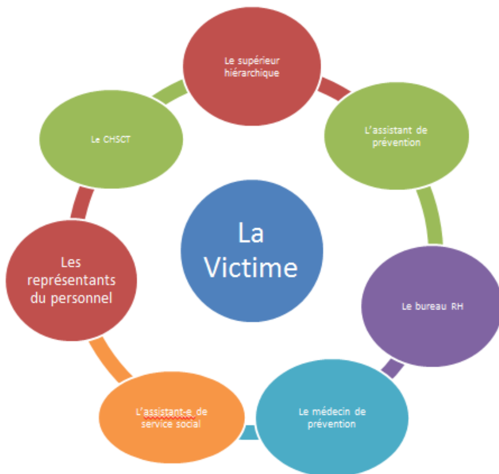
Schéma des intervenants qui peuvent être sollicités dans une situation de violence sexiste ou sexuelle.